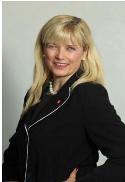
Lydwina von der Grün Sparkasse Nürnberg